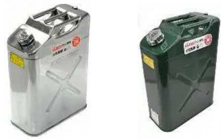
※携行缶本体サイズ(約W345mm×D175mm×H470mm)